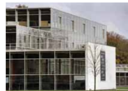
Hogeschool voor de Kunsten