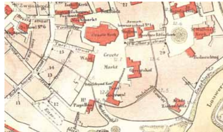
Detail van de stadsplattegrond uit 1875

Nederlanden. Arnhem ontwikkelde zich verder als provinciaal centrum van bestuur en rechtspraak. Veel van de verdedigingswerken werden gesloopt omdat ze niet meer nodig waren, ook die rondom de Sabelspoort. Aan de zuidzijde van de Markt werd het hotel des Pays Bas gebouwd. Aan de oostwand van het marktplein verrezen in deze eeuw grote gebouwen: op de plek van het Prinsenhof kwam het Gouvernementsgebouw (1804-1924) en vlak ernaast het Paleis van Justitie (1838). Het Duivelshuis ging vanaf 1830 dienst doen als stadhuis. Aan de westzijde van het plein kwam het Waaggebouw te staan.