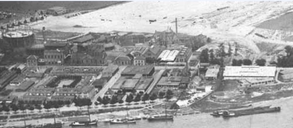
Luchtfoto van de gasfabriek en de Westervoortsedijk (ca 1925)

Tot 1965 domineerde de Arnhemse Gasfabriek het industriële landschap van Arnhem. De fabriek is al lang ter ziele en wat rest is een ernstige vervuiling. Een schrale troost, Arnhem is 'slechts' één van de vele vervuilde terreinen in Nederland. Maar er is een grote schoonmaakactie gaande: tussen 2005 en 2015 worden 148 gasfabrieksterreinen gesaneerd. Het terrein aan de Westervoortsedijk is één van de laatste in die rij, één van de grootste én het enige dat archeologisch wordt onderzocht. En dat is bijzonder want het is nog niet eerder voorgekomen.