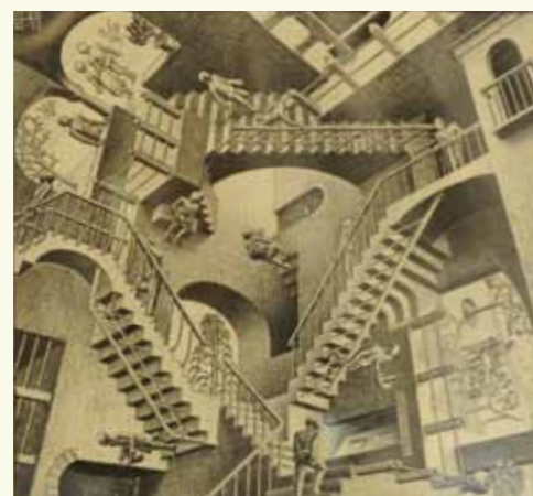
Het trappenhuis in de hbs aan de Schoolstraat in het Spijkerviertel in Arnhem inspireerde Escher tot het maken van zijn beroemde prent 'Klimmen en dalen'.

De trap van zijn middelbare school vormde voor de beroemde graficus M.C. Escher een inspiratiebron voor een aantal van zijn beroemdste prenten. Het markante geheel van bordestrappen, balustraden en moorse zuilen die de hal van de HBS aan de Schoolstraat kenmerken, is in die prenten herkenbaar terug te vinden.