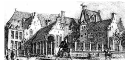
Hof van Gelre (1742)

Arnhem kreeg in 1233 stadsrechten toegekend. Kort daarna werd de stad voorzien van een stadsmuur met enkele stadspoorten. Via de Eusebiuspoort (later Sabelspoort) kwam men op de 'Oude Marckt'. Dit was eeuwenlang het grootste plein van de stad en werd daarom ook wel