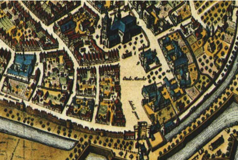
Detail van de stadsplattegrond uit 1650, getekend door Joan Blaeu (1. Grote Kerk; 3. Prinsenhof; 9. Stadhuis)

Het Prinsenhof heeft grote betekenis voor Arnhem. Het gebied rond de Markt staat al eeuwen bekend als een centrum van Bestuur en Rechtspraak. Op de Markt in Arnhem kwamen in de zeventiende eeuw de Staten van Gelderland samen in het Hof van Gelre. Dit Hof stond ook bekend onder de namen Stadhoudershof en later Prinsenhof. De prinsen Maurits en Frederik Hendrik waren hier stadhouder. Na 1813 werd de Prinsenhof officieel de plaats waar het provinciebestuur bij elkaar kwam. Nog steeds zetelt de Provincie op de plek waar vroeger het Hof van Gelre was.